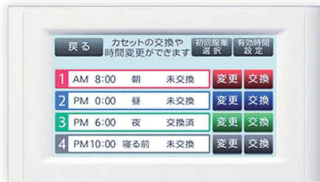
服薬時間設定画面