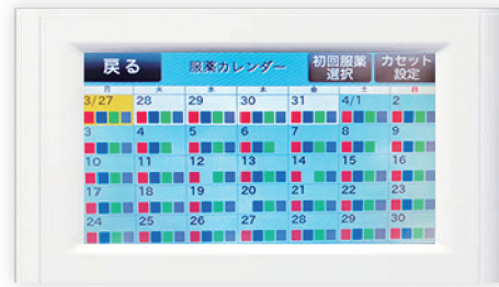
カレンダー設定画面

画面と音声で服薬時間をお知らせ。時間表記12時間モード/24時間モードが選択可能です。