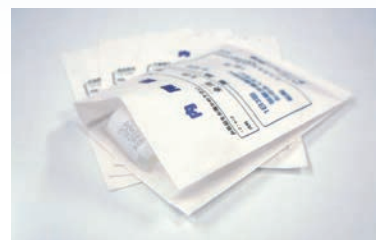
ガゼット薬袋 マチ付き

操作メニューがわかりやすい5型タッチパネルを採用。エラー表示は光や音でやさしくシンプルにお知らせします。