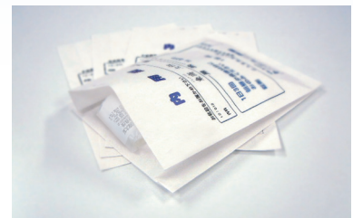
ガゼット薬袋 マチ付き

操作メニューがわかりやすい5型タッチパネルを採用。エラー表示は光や音でやさしくシンプルにお知らせします。