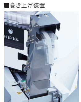
分包済み分包装紙を操作者の腰元まで巻き上げて排出します。

※改良のため、仕様・構成などを予告なく変更させていただく場合がございます。 ※本カタログは印刷のため、実際の色と異なることがあります。