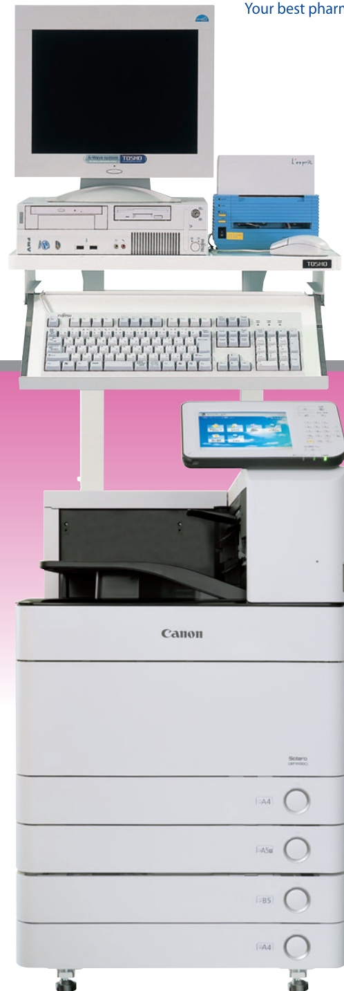
専用架台、ラベルプリンター (オプション) 専用架台と組み合わせることにより省スペース化が図れます。

Prescription checking System Automatic Ampule Dispenser Medical Bag Print System LAN Server Full Automatic Tablet Packer Medication Indicating Equipment Full Automatic Powdered Medicine Packer