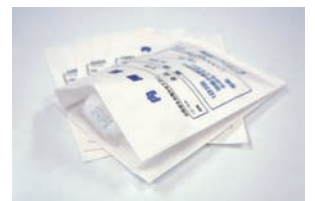
ガゼット薬袋 マチ付き

標準排紙トレイに4ピンプリントポストを組み合わせることにより、計5ピンの排紙トレイでご要望別に出力先を分けることを可能にする便利な機能です。