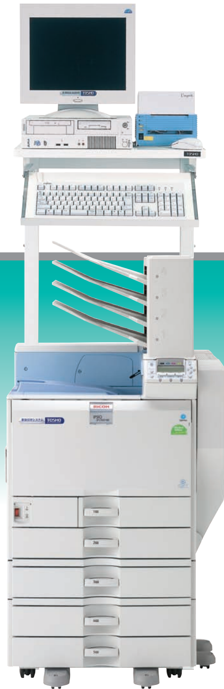
専用架台、ラベルプリンター（オプション） 専用架台と組み合わせることにより省スペース化が図れます。

高性能&使いやすさの両立 簡単・安心・多機能な印刷環境 調剤業務の効率化を強力に サポートする薬袋印字システム。